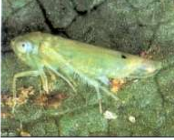
Bağ yaprakpiresi ergini

( Asymmetrasca (=Empoasca) decedens Empoasca decipiens )