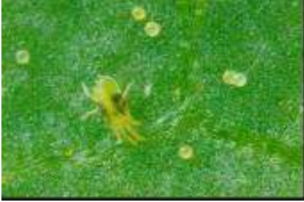
İkinoktalı kırmızıörümcek ergini ve yumurtası