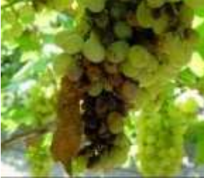
Salkım güvesi 3. dölünün olgun tanelerde zararı