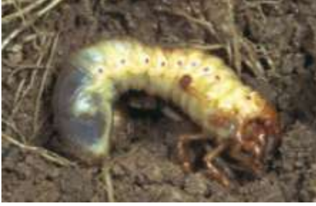
Haziran böceği larvası