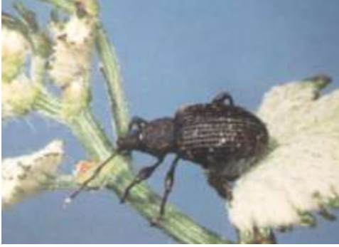
Salkım maymuncuğu ergini