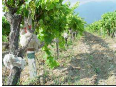
Silikonize elyafın bağlanması