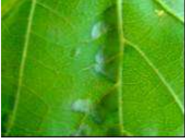
Bağ yaprakuyuzu'nun yaprak altındaki zararı