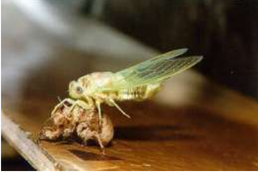
Asma ağustosböceği ergini

( Klapperichicen (=Chloropsalta) viridissima )