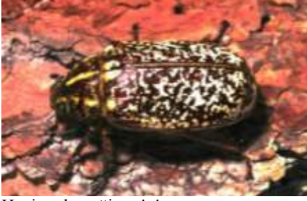
Haziran böceği ergini