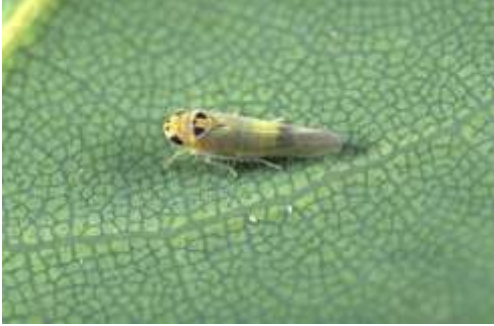
Bağ üvezi ergini