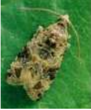
Salkım güvesi ergini