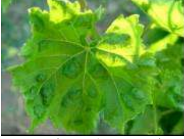
Bağ yaprakuyuzu'nun yaprak üstündeki zararı