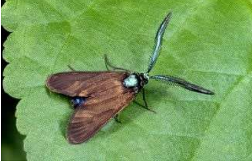
Bağ göz kurdu ergini