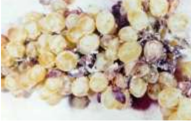
Salkımda Unlubit zararı