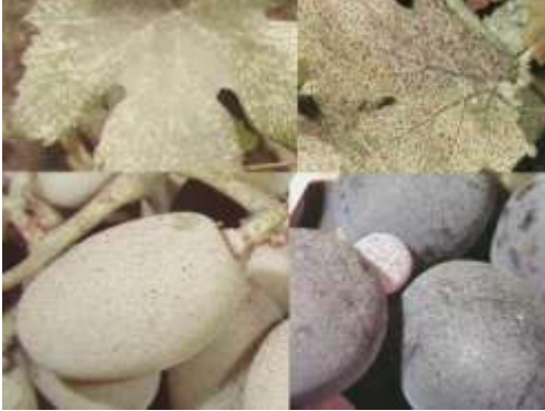
Bağ üvezi zararı