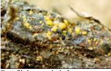
Bağ filokserası kök formu