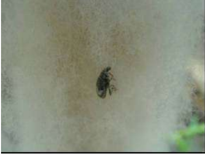
Silikonize elyafa yakalanan Maymuncuk ergini

( Otiiorhynchus scitus , O. Peregrinus , O. Sulcatus , O. Anatolicus , O. Ligustici , O. turca , O. Aurifer , O. Carceli , O. rugosostriatus , Megamecus sheveti , M. albomarginatus )