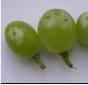
Tanelerde thrips zararı

Bağ thrips ( Anaphothrips vitis ), Asma thrips ( Drepanothrips reuteri ), Bağ kahverengi thrips ( Haplothrips globiceps )