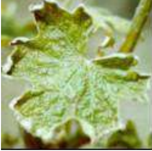
Yapraklarda thrips zararı