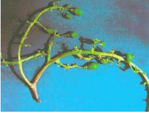
Salkım maymuncuğu zararı