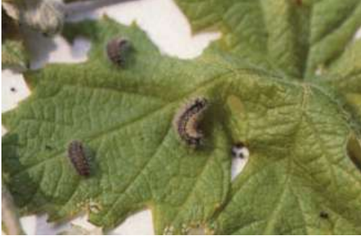
Bağ göz kurdu zararı