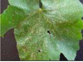
Bağ yaprakpiresi' nin yaprakta emgi lekeleri